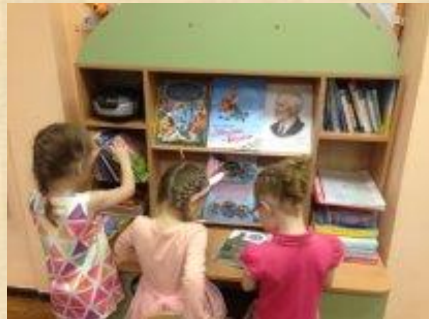
Книжный уголок группы «Золотая рыбка»